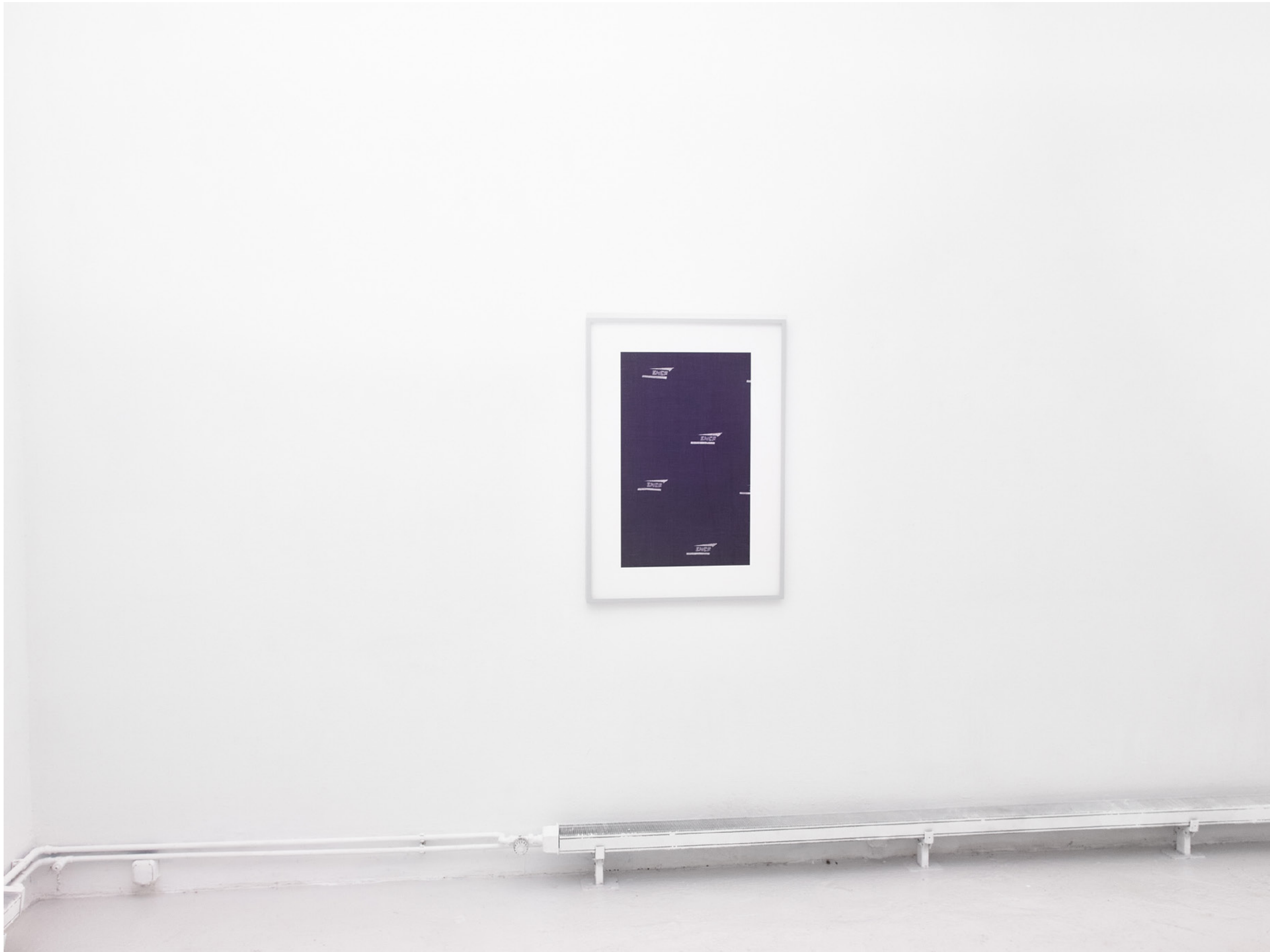
Sncf , 2022, Pigmentdruck, gerahmt (pigment print, custom frame), 95x66,5 cm