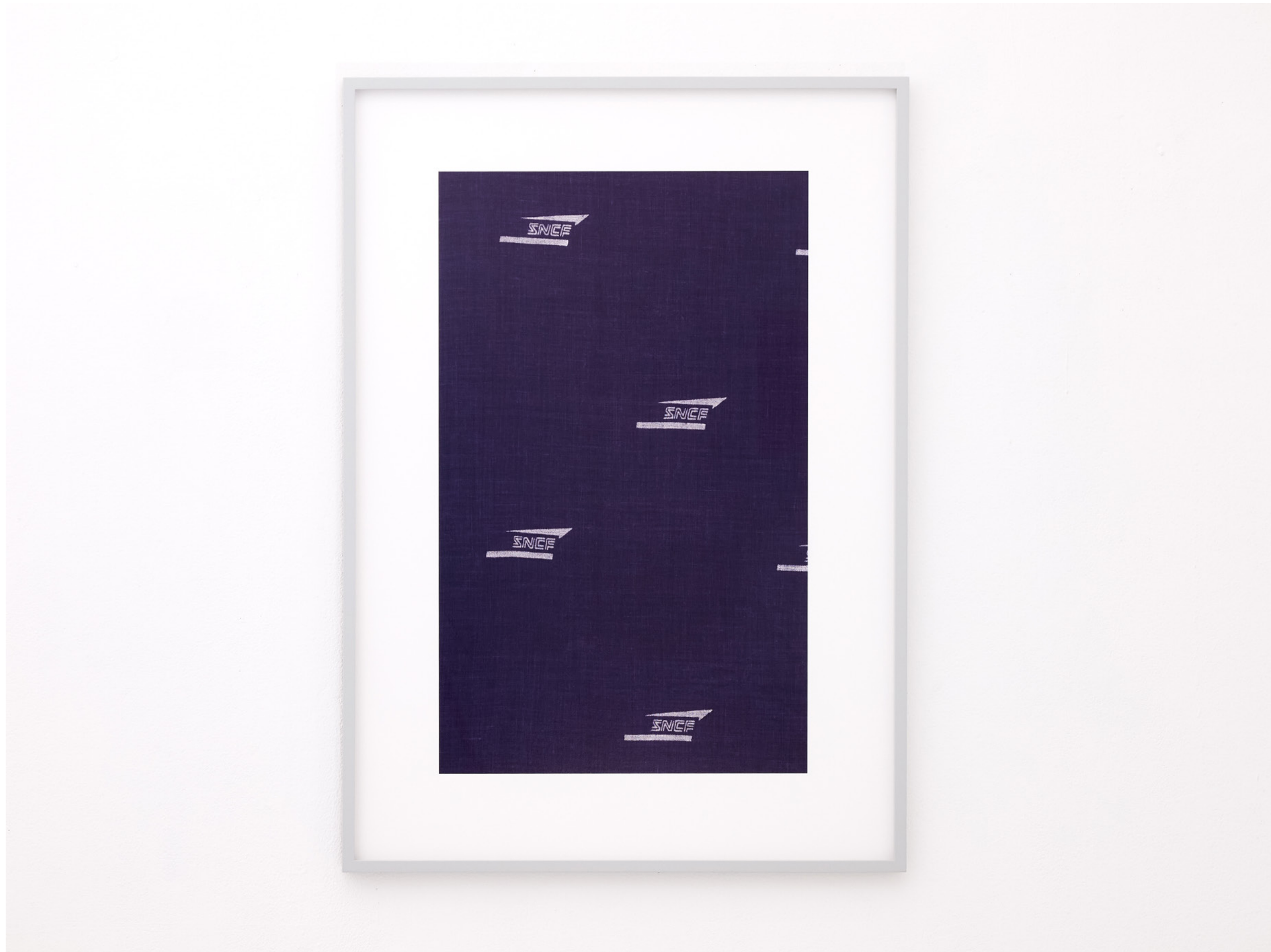
Sncf , 2022, Pigmentdruck, gerahmt (pigment print, custom frame), 95x66,5 cm