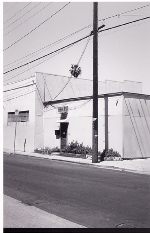
Union Pacific Ave 3783 , 2022, Pigmentdruck, gerahmt (pigment print, custom frame), 69x51,5 cm