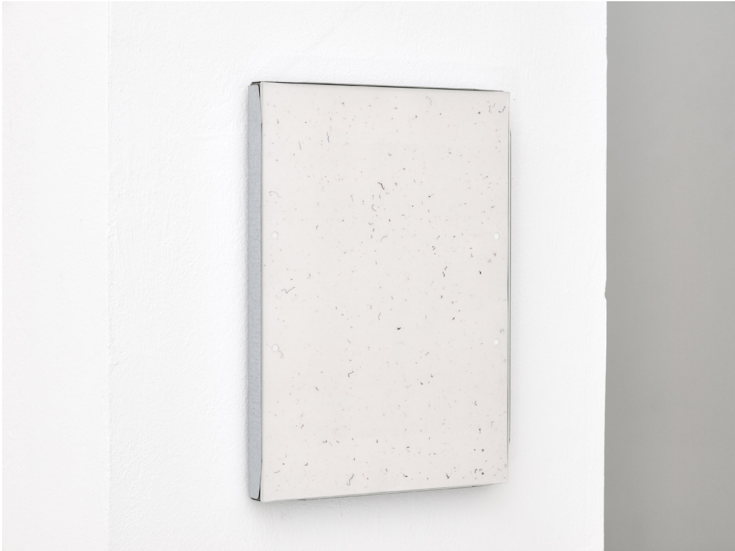
film , 2022, Laserdruck auf OHP Folien, UV Acrylglas, Magnetraahmen (laserprint on ohp sheets, uv glass, magnetic frame), 30x21x3cm