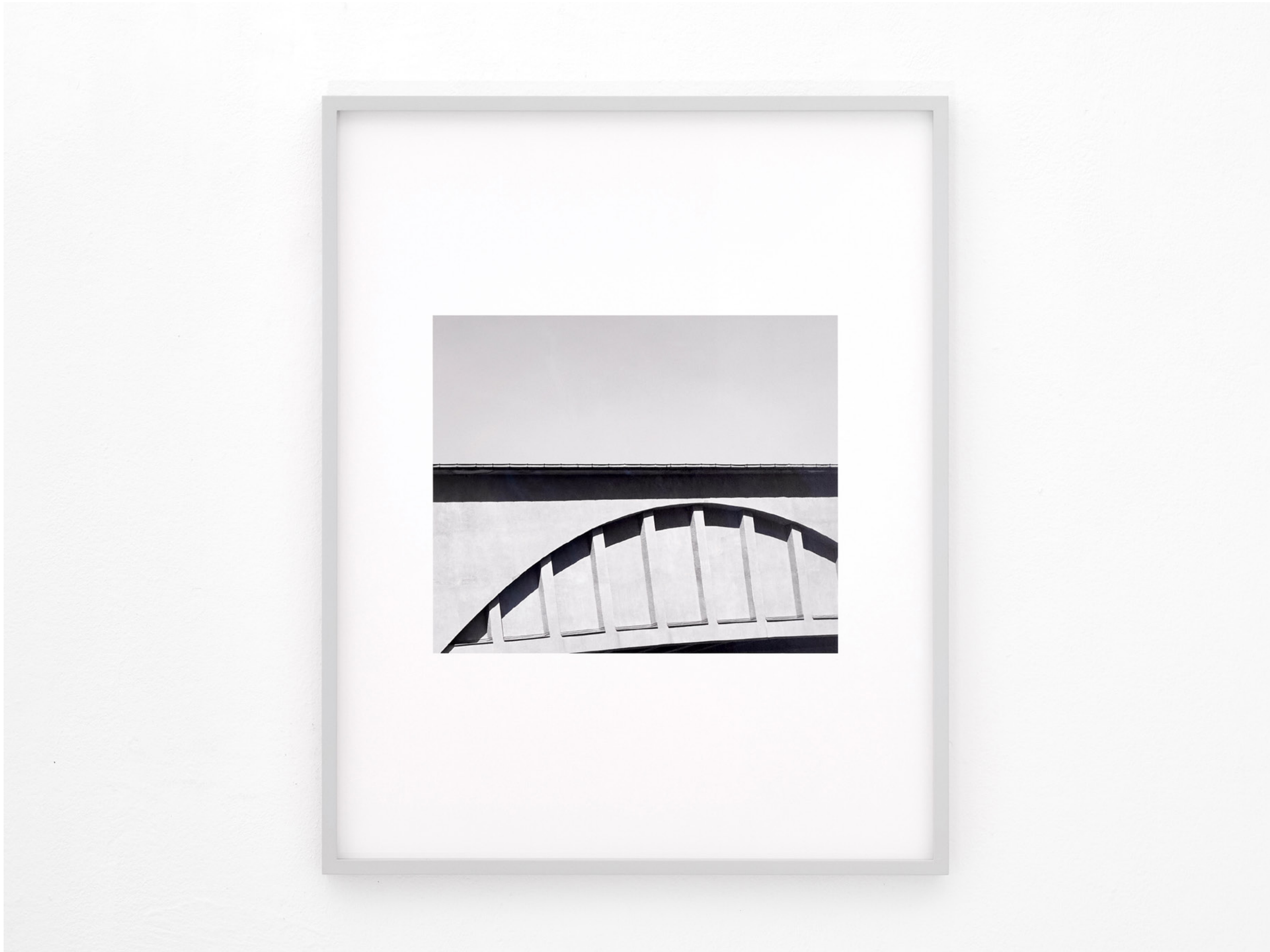
Gleisdreieck , 2022, Pigmentdruck, gerahmt (pigment print, custom frame), 64,5x51,5 cm