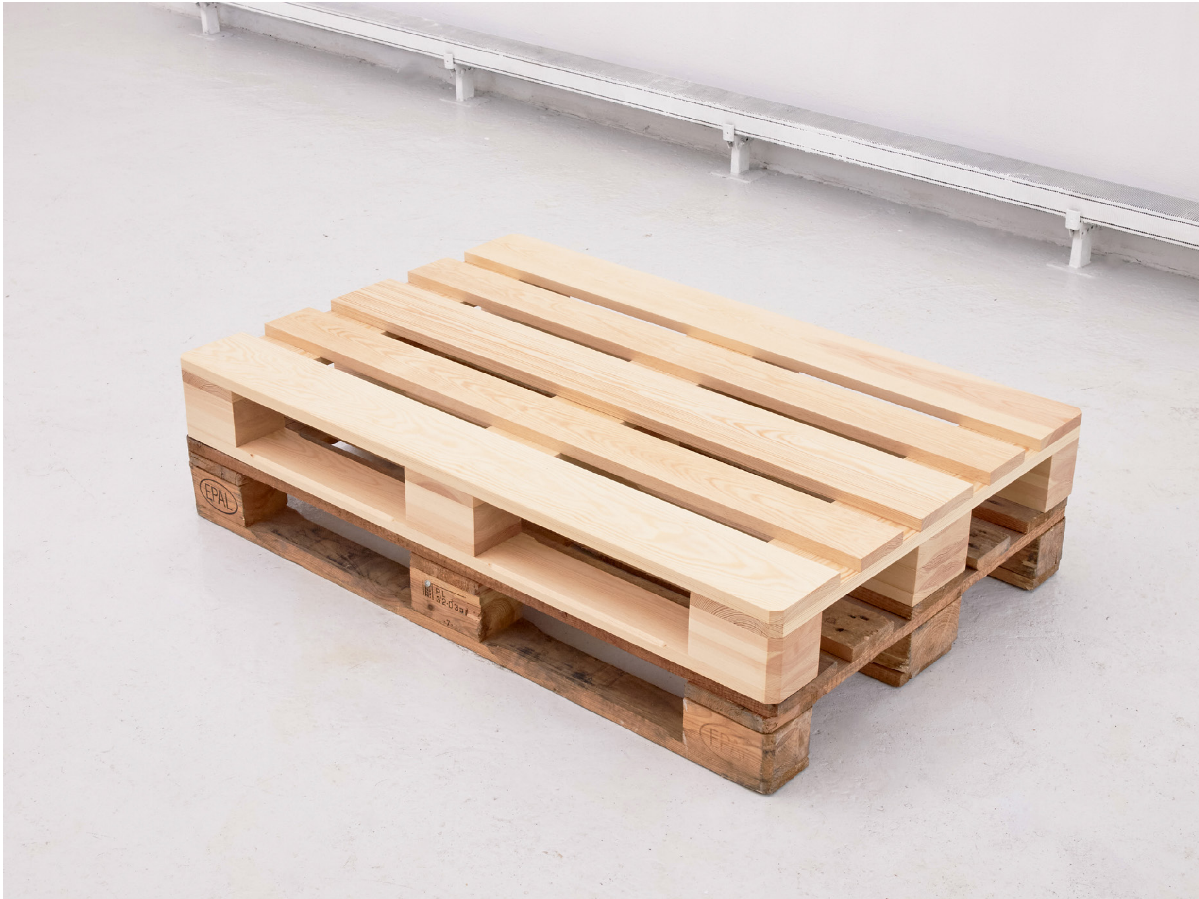
stack , 2022, Kiefernholz, Europalette (pine wood, euro-pallet), 120x80x28 cm