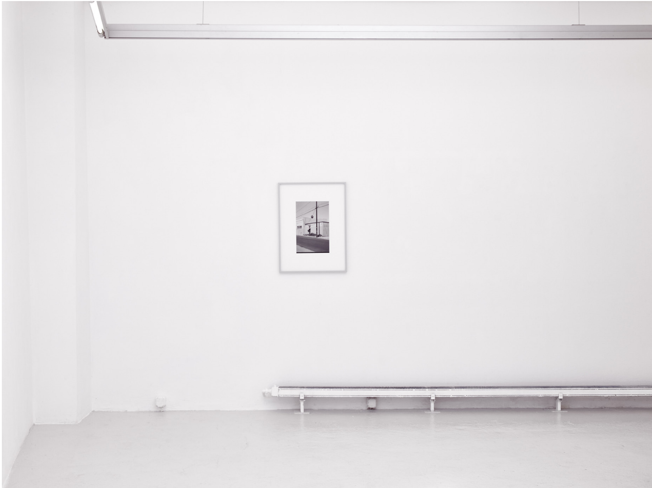
Union Pacific Ave 3783 , 2022, Pigmentdruck, gerahmt (pigment print, custom frame), 69x51,5 cm