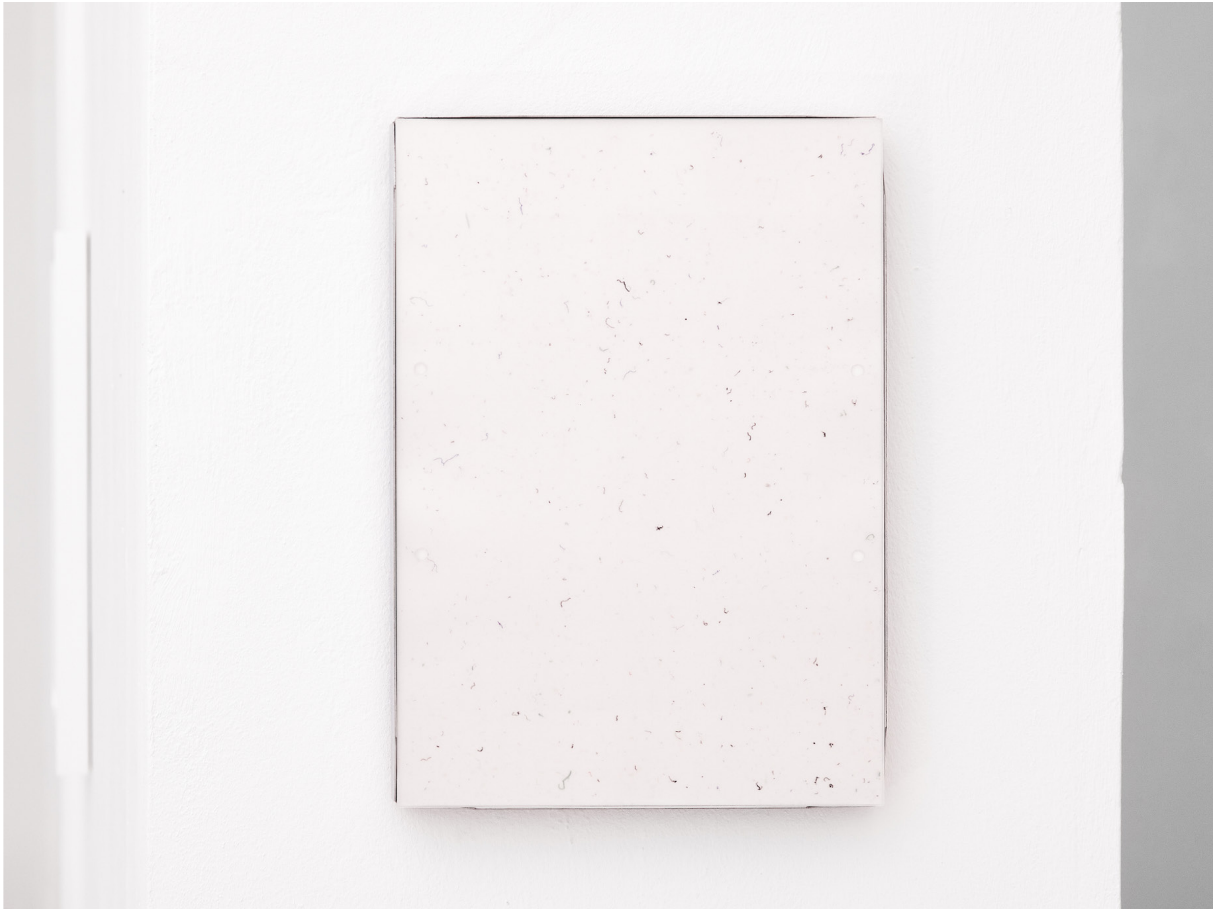
film , 2022, Laserdruck auf OHP Folien, UV Acrylglas, Magnetrahmen (laserprint on ohp sheets, uv glass, magnetic frame), 30x21x3cm