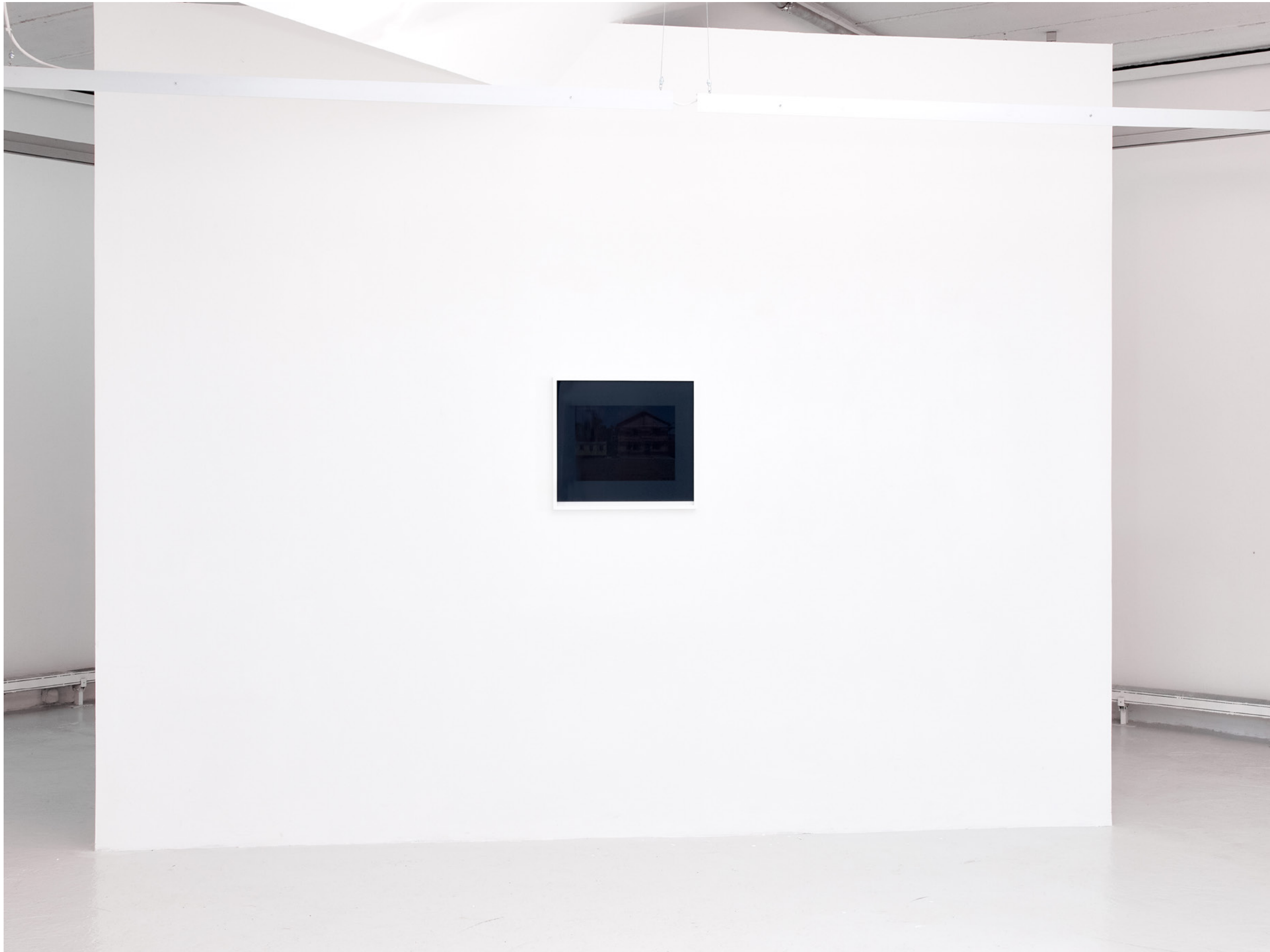
Good Bye , 2022, Pigmentdruck, gerahmt, Glas 2-geteilt grau/transparent (pigment print, custom frame, split glass panels, gray/clear), 46x51,5 cm