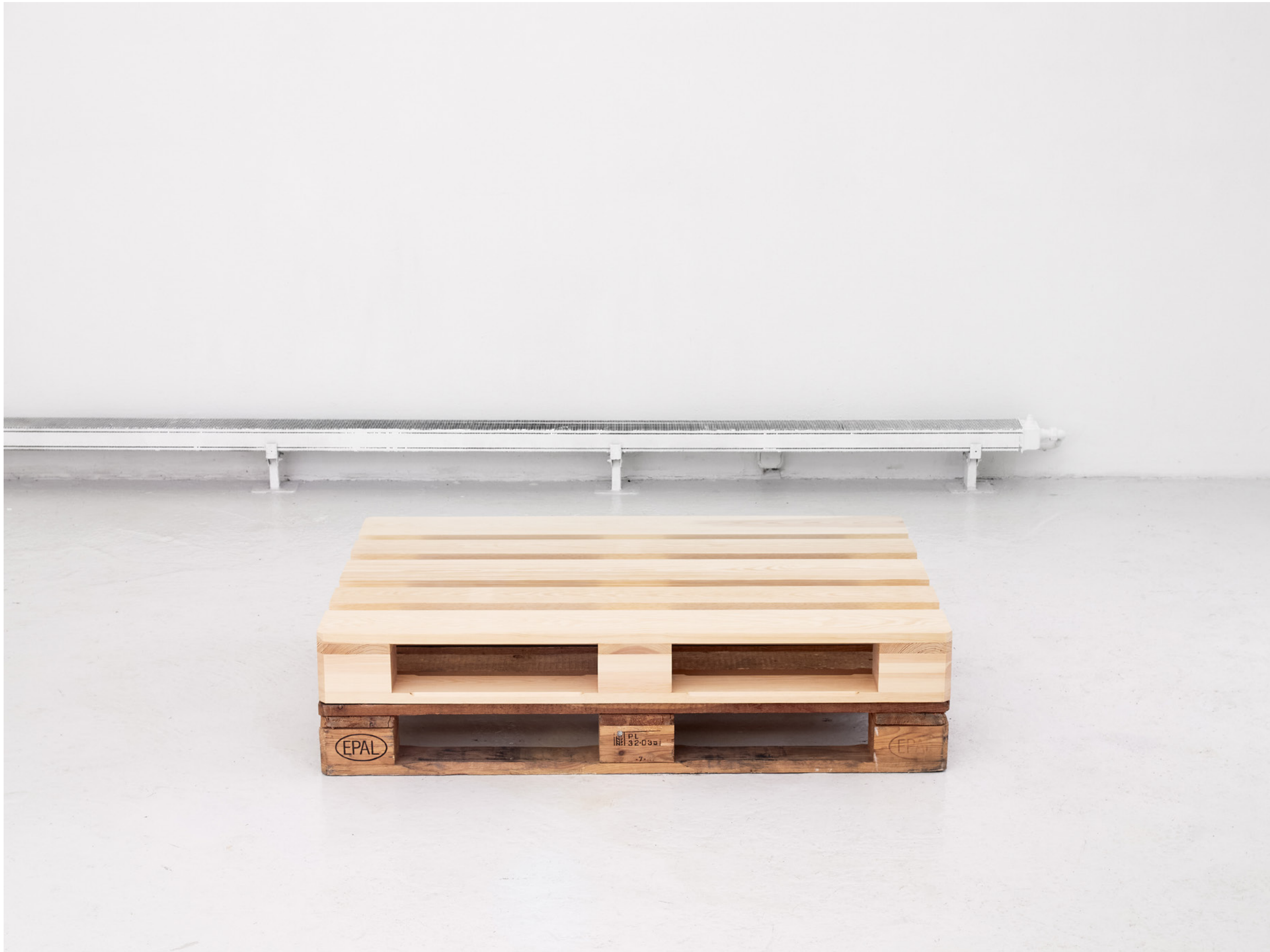
stack , 2022, Kiefernholz, Europalette (pine wood, euro-pallet), 120x80x28 cm