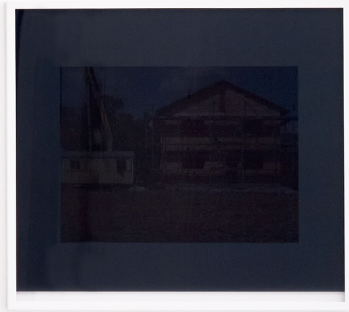
Good Bye , 2022, Pigmentdruck, gerahmt, Glas 2-geteilt grau/transparent (pigment print, custom frame, split glass panels, gray/clear), 46x51,5 cm